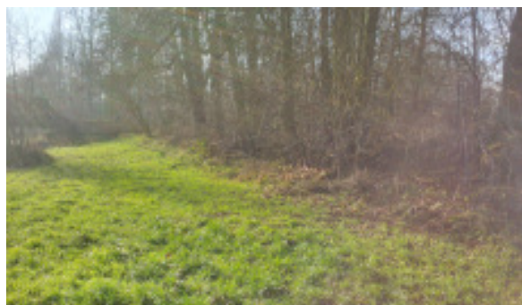
Zustand vor der Sanierung